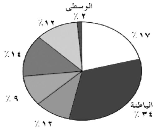
شكل يمثل توزيع الباحثين عن عمل على محافظات ومناطق سلطنة عمان

أ - اسم المنطقة / المحافظة التي بلغت بها نسبة الباحثين عن عمل 14% .